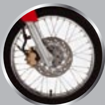
BREK CAKERA Utamakan keselamatan dengan brek cakera