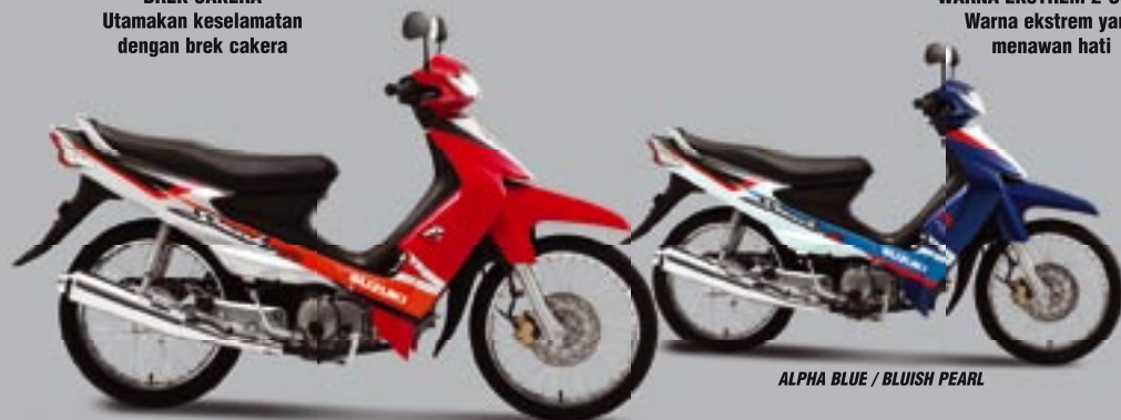
MICA RED / BRILLIANT SILVER

Dapatkannya dalam Mica Red/ Brilliant Silver atau Alpha Blue/ Bluish Pearl. Suzuki Smash Pro menawan pemandu yang sentiasa muda di hati.